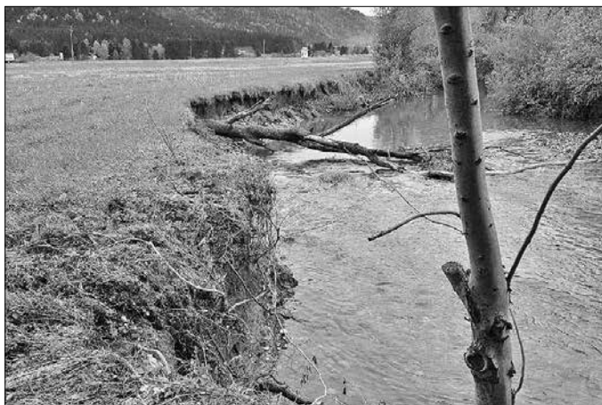
Dreta se marsikje zajeda v bregove in odnaša zemljinjo.

Občinska uprava Občine Nazarje Fotodokumentacija Občine Nazarje