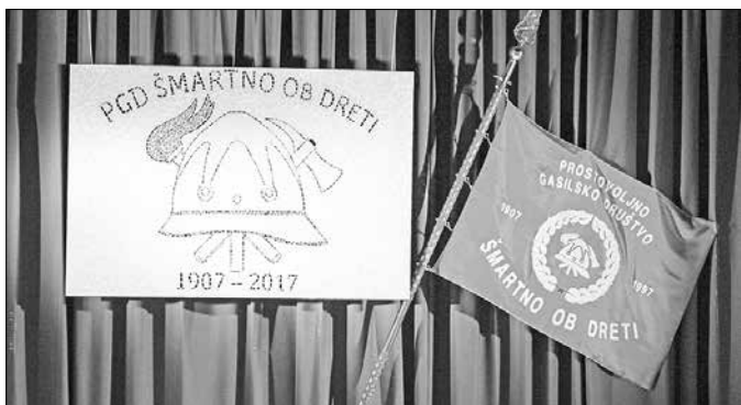
Društvo se ponaša z več kot stoletno zgodovino.

V mesecu juniju je v Šmartnem ob Dreti več dni potekalo dogajanje ob proslavljanju 110. obletnice delovanja tamkajšnjega prostovoljnega gasilskega društva. Na slavnostni seji so bila podeljena visoka priznanja tako društvu kot zaslužnim članom. Ob obletnici so gasilci izdali jubilejno brošuro