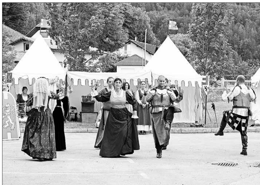
Muzej je soorganizator Srednjeveškega dne.

Muzej Vrbovec poleg osnovne dejavnosti ohranjanja kulturne dediščine gozdarstva in lesarstva opravlja tudi vlogo turistično informacijskega centra. Zaradi delovnega časa muzeja, ki poleti obratuje od torka do nedelje med 9. in 17. uro, so domačim in tujim turistom skozi ves dan na voljo številne informacije in gradiva z območja celotne Zgornje Savinjske doline. Da smo seznanjeno z novostmi in trendi, neprestano dopolnjujemo znanja na področju turizma. Če želiš ponujati, moraš poznati. To je načelo, ki se ga je potrebno držati, zato se velikokrat tudi sami odpravimo na pot po naši Zgornji Savinjski dolini.