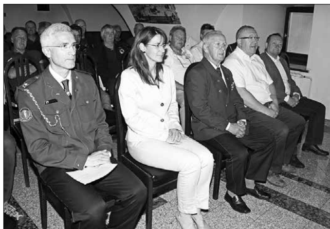
Veterani so v goste povabili ministrico za obrambo Andrejo Katič.