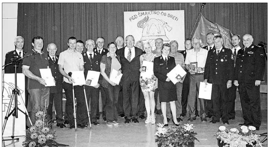
Prejemniki priznanj in gostje na slavnostni seji