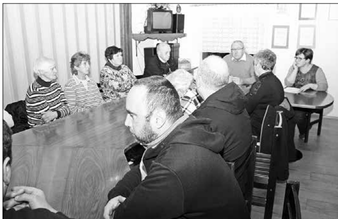
Volitve novega odbornika ali odbornice

Ponosni smo lahko na kulturno in naravno dediščino, ki jo ohranjamo in je pravi magnet za obiskovalce iz domovine in tujine. Seveda je naša ugotovitev laična in ne temelji na raziskavi. Vendar vaščani lahko povedo, da je v času turistične sezone v vaseh vedno več pohodnikov, kolesarjev, ribičev in tistih, ki samo raziskujejo deželo z avtomobilom. Veliko delo opravi na tem področju LD Dreta, ki za varovanje naravne dediščine namenja sredstva in prostovoljno delo. Želimo si narediti več s spodbujanjem naših vaščanov, ki bi gostom lahko ponudili ogled kulturnih znamenitosti in svoje odlične izdelke na kmetijah.