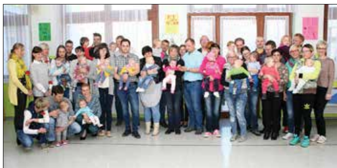
Družine z novorojenčki na sprejemu, ki sta ga pripravili Občina Nazarje in tukajšnja osnovna šola ter vrtec.