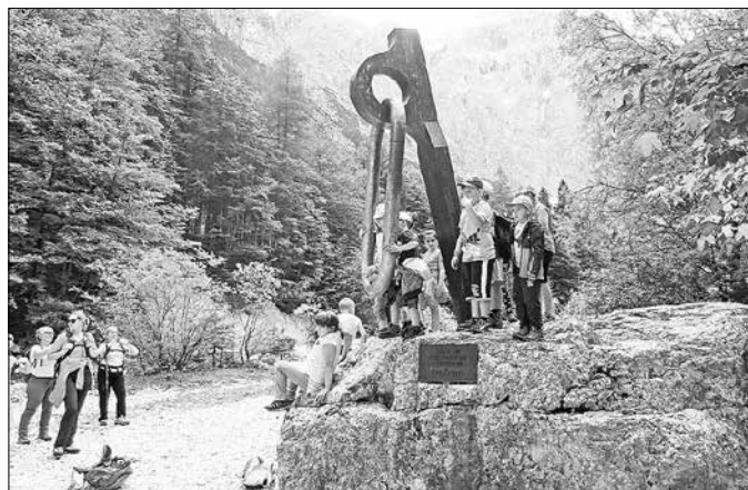
Mladi planinci pod Triglavom

Delo društva »itak« temelji na prostovoljstvu. Pri tem so najbolj aktivni člani gospodarskega odseka (v ustanavljanju), ki vlagajo svoj čas in delo za obnovo Farbance. V letošnjem letu je njihov največji delovni uspeh napeljava nove centralne kurjave z novim kaminom. Tako bo okoljski odtis naše kočice še manjši in se bomo v prihodnje morda potegovali za certifikat PZS »okolju prijazna planinska kočica«. Nad domom smo