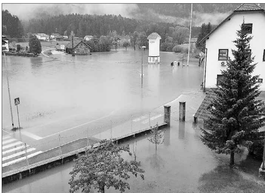
Poplavljen površine v Šmartnem ob Dreti po deževju 28. aprila

V letu 2017 smo prejeli obvestilo Direkcije za ceste, da so začeli s prenovo projekta zamenjave neustreznega mostu preko Letošča na državni cesti v kraju Volog. Most je postavljen pod neustreznim kotom, zato se pod njim kopiči preveč peska, most pa poplavno ogroža sosednje hiše. Po pridobitvi soglasij na prenovljen projekt bo sledil izbor izvajalca del, zemljišča so bila že pred časom s strani države odkupljena. Izvedba obnove mostu preko Volažnice v Šmartnem bo v sodobni betonski, namesto v sedanji leseni izvedbi.