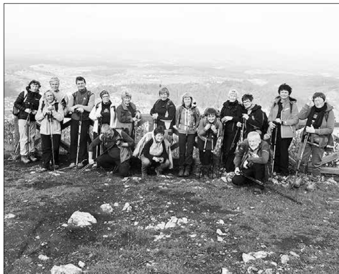
Člani društva se udeležujejo planinskih pohodov različnih težavnosti. Ta fotografija je nastala na vrhu Rifnika.

Seveda pa moram na kratko poudariti naše delo v Zvezi društev upokojencev Slovenije (ZDUS), kjer sem podpredsednica in je delo še toliko bolj zahtevno in sicer poteka prava bitka za gnotni položaj upokojencev, za njihovo aktivno staranje, za dostopno in urejeno zdravstvo varstvo, za krepitev pomoči starejšim, za socialne pravice, za bivanjski standard, za krepitev prostovoljstva, za dolgotrajno oskrbo, za demografski sklad... Kot vam je verjetno znano, smo dosegli dvig najnižjih pokojnin (seveda morajo biti za to z zakonom izpolnjeni