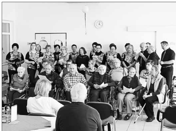
Martinovemu zboru so se v Gornjem Gradu pridružili tudi varovanci.

Območno združenje veteranov vojne za Slovenijo