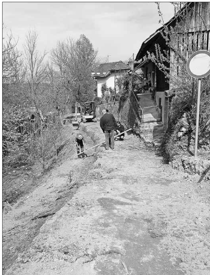
Ureditvena dela na cesti v Potoku

Obnova Centralne čistilne naprave Loke pri Mozirju (v nadaljevanju CČN Mozirje) je bila poleg izgradnje krožišča v centru Nazarje, v obdobju 2016-2017, največja investicija Občine Nazarje, zato ji v tem članku posvečamo več pozornosti. Za izvedbo skupnega projekta so občine investitorke Mozir-