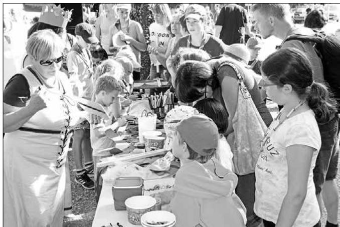
Otroci so se z veseljem udeležili delavnice, ki jo je na Srednjeveški gostiji pripravilo društvo.

Otroci so naša prihodnost, zato z našimi pridnimi člani Turističnega društva Nazarje že več kot dve desetletji organiziramo in pripravljamo prireditve in različne delavnice. Tako se lahko otroci zabavajo na pustovanju, miklavževanju, velikonočnih in predbožičnih ustvarjalnih delavnicah. Med poletnimi počitnicami se delavnice odvijajo na različnih lokacijah v naši občini z različnimi dejavnostmi kot so: igre z žogo,