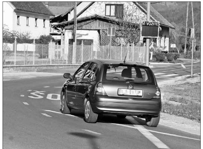
Prikazovalnik hitrosti v Šmartnem ob Dreti za varnejšo pot najmlajših v šolo in vrtec

Občina Nazarje predvideva za letošnjo jesen obnovo odseka lokalne ceste Šmartno-Brdo. Zaradi visokih vrednosti je trasa razdeljena na 2 sklopa z izvedbo v dveh letih. V letu 2017 se bo predvidoma urejal odsek od državne ceste do mostu pre-