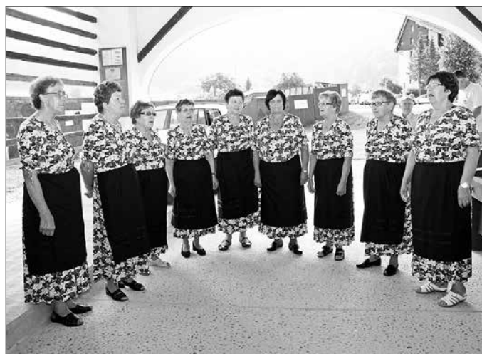
Ljudske pevke Lipa z veseljem nastopajo na različnih prireditvah

Z ljudsko pesmijo razveseljujejo ne le domače občinstvo, ampak ime naše občine ponašajo tudi izven njenih meja. Ohranjanje ljudske pesmi doživljajo kot pomembno poslanstvo. Skrivnostno lepoto teh, velikokrat že skoraj pozabljenih pesmi, podajajo z zavedanjem, da se bo ohranila le, če se ji ne bomo sami odrekli. Da bi njihova pesem dosegla še širši krog poslušalstva, so v obdobju svojega 10-letnega delovanja izdale tudi dve zgoščenki z ljudskimi pesmimi: Pod lipico zeleno (2009), Takšna sem jaz mlada bila (2012).