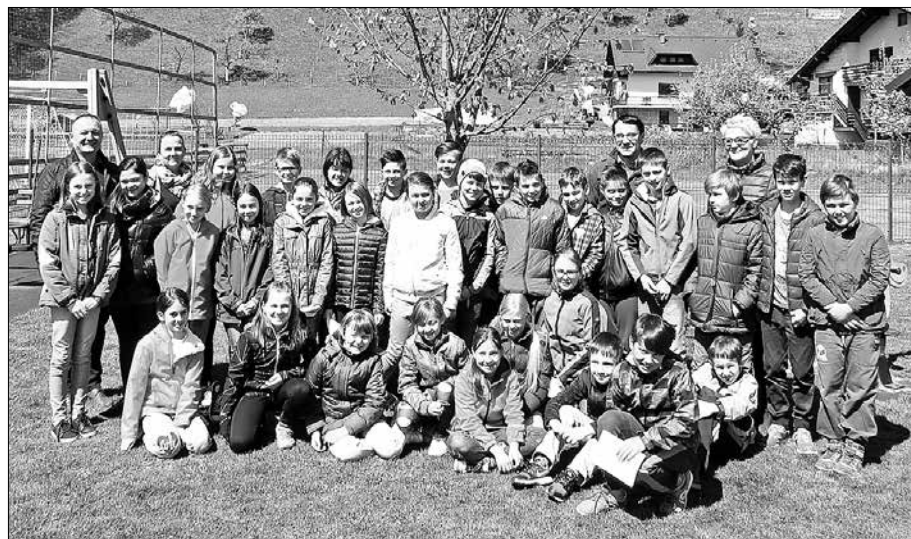
Mladi so obiskali lipo, ki so jo posadili pred sedmimi leti.

V februarju smo v sodelovanju z ZGS in Knjižnico Mozirje organizirali predavanje z naslovom V gozd po modrost - zgodba gozdne pedagogike v Sloveniji. Predavanje je bilo odlično obiskano, saj se ga je udeležilo okrog 70 obiskovalcev. Razveseljivo je, da je bila večina udeležencev predstavnikov vzgojnoizobraževalnih institucij iz naše doline. Namen pre-