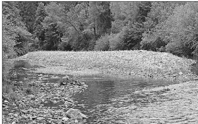
Prodišče v Spodnjih Krašah letos konec julija

Padavinski režim se spreminja, kar vpliva tudi na pogostost dni s padavinami nad izbranimi pragovi. Poleg sprememb v letnem merilu so še večje spremembe v pogostosti in intenziteti po posameznih letnih časih. Vsako leto nas prizadene več neurij z močnim vetrom, nalivi in tudi toča. Lokalno se