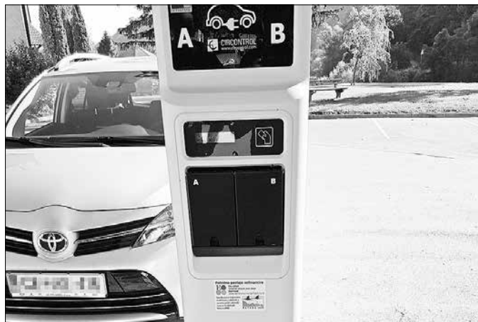
Polnilna postaja na parkirišču pri Vrbovcu je pripravljena za polnjenje dveh avtomobilov hkrati.

Center za samostojno učenje Nazarje (CSU)